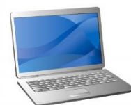
ノートPCのクッション