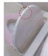
便フタのクッション